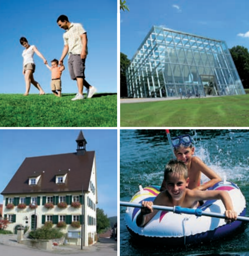
Schwabsberg - Dalkingen - Buch - Weiler - Saverwang