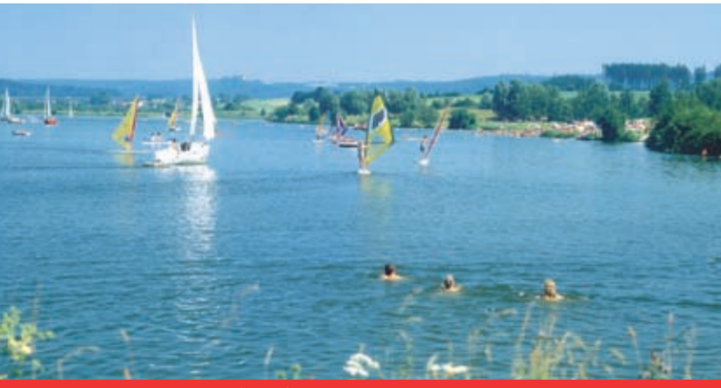
↑ Bucher Stausee