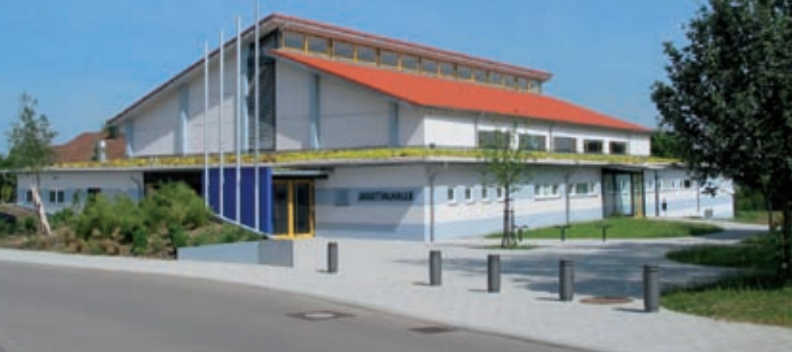
↑ Jagsttalle, Schwabsberg ↓ Dorfhaus Saverwang